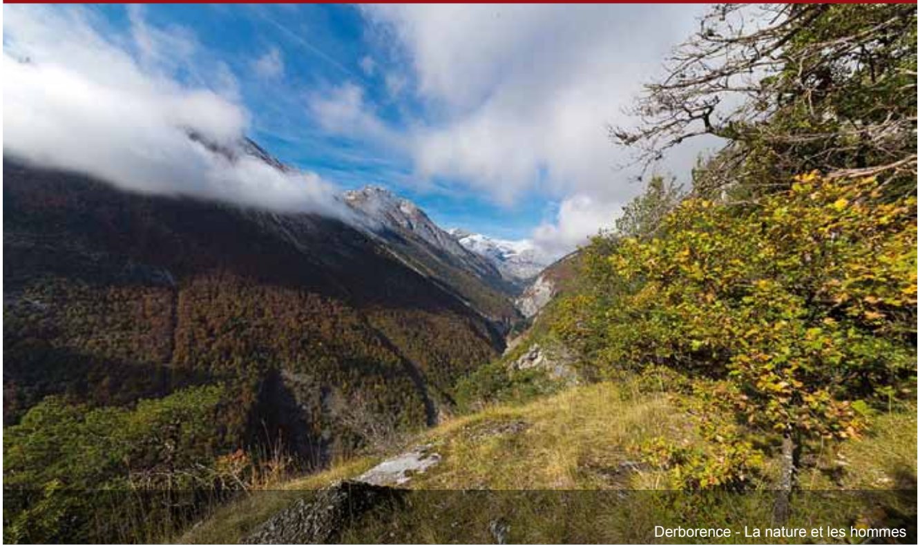
Derborence - La nature et les hommes