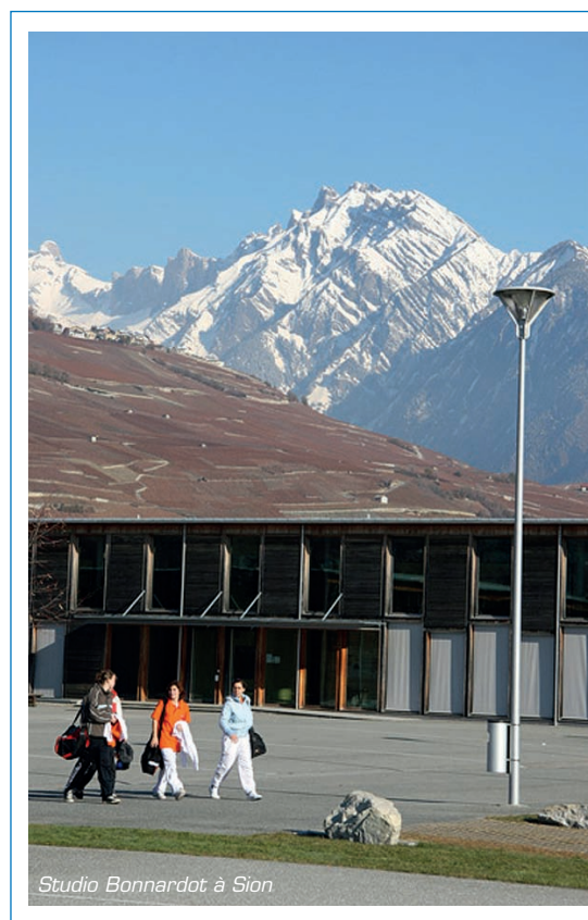
Studio Bonnardot à Sion